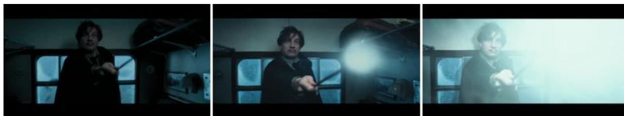
Imagen 3: Plano medio corto para identificación emocional con el profesor Lupin, gradación de tonos alta para grandiosidad. "Harry Potter y el Prisionero de Azkaban" (2004) Alfonso Cuarón

Tras el ataque del dementor , el profesor Lupin se despierta, e inmediatamente lanza el encantamiento patronus. En la secuencia de la Imagen 3 se observa un plano medio que permite la identificación emocional entre el profesor y el espectador Millennial (Bárcena-Díaz, 2012). Este plano es importante porque el profesor es una figura humana con la cual el Millennial se puede identificar, además que hay una gradación de tonos luminosos que parten de la varita del profesor Lupin, estos tonos altos representan su grandiosidad (Fernández-Almoguera and López-López, 2017). Además, se presentan colores contrastantes (blanco y negro) que generan un efecto de impacto en el espectador (Fernández-Almoguera and López-López, 2017). Este efecto sirve para que el Millennial siga prestando atención al filme, esto se relaciona con la segunda etapa de la instrucción de Bruner: El mantenimiento, donde el interés del alumno debe mantenerse durante toda la lección (Bruner, 1960).