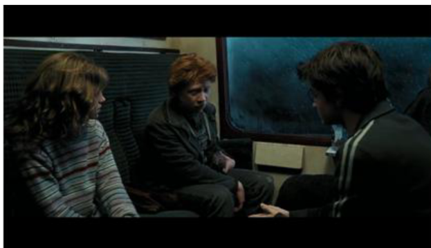
Imagen 1: Plano medio para emociones de Harry, Hermione y Ron, colores cálidos para vitalidad. "Harry Potter y el Prisioner de Azkaban" (2004) Alfonso Cuarón

Primeramente, en la Imagen 1, se muestra a Harry Potter con sus amigos: Hermione y Ron en un tren, esto presentado con un plano medio que les da más importancia a los aspectos emocionales de los personajes (Bárcena-Díaz, 2012). Además, alude al sentimiento de vitalidad al usar colores cálidos (Fernández-Almoguera and López-López, 2017), esto ayuda a unir a los tres personajes y a crear un patrón de color psicológico para el espectador, que produce un efecto anímico de proximidad con los personajes (Fernández-Almoguera and López-López, 2017), además que el fondo claro da un ambiente de alegría y otorga importancia a los personajes como un conjunto. Por lo que estos rasgos llevan al espectador a tener una sensación agradable al ver a un Millennial pasar tiempo con sus amigos, esto además es el primer elemento cultural Millennial, el cual comenta que gran parte de la felicidad Millennial se obtiene al pasar tiempo con amigos (Kurz et al., 2013).