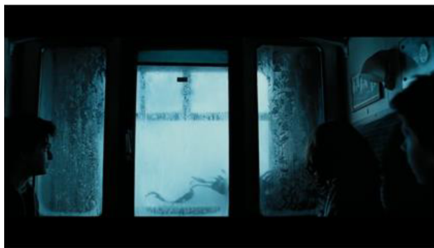
Imagen 2: Plano americano que desprecia el fondo, cambio a colores fríos para presentar la atonía. "Harry Potter y el Prisionero de Azkaban" (2004) Alfonso Cuarón

en el espectador Millennial (Bruner, 1960). Además, todas las emociones asociadas con el dementor se relacionan con el segundo elemento cultural Millennial, que es una generación seriamente impactada por el terrorismo (Kurz et al., 2013), correlacionando al terrorismo con los sentimientos transmitidos por un dementor .