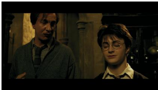
Imagen 4: Primer plano para eliminar la importancia del fondo, luz cenital para aislar el fondo. "Harry Potter y el Prisionero de Azkaban" (2004) Alfonso Cuarón

personaje (Bárcena-Díaz, 2012). Además, la luz cenital permite aislar el fondo y otórgale más atención al mismo, por otro lado, los colores cálidos dan una impresión de vitalidad (Fernández-Almoguera and López-López, 2017). Estos elementos cinematográficos otorgan una realidad que refuerza el vínculo entre Harry Potter y el espectador, a través de una sutura preconsciente donde se transfieren sentimientos. Esto además tiene que ver con la etapa del mantenimiento de Bruner, donde el alumno mantiene su atención a la sesión del estudio (Bruner, 1960), esto se logra a través de los elementos cinematográficos que le atribuyen a Harry Potter una importancia desmedida.